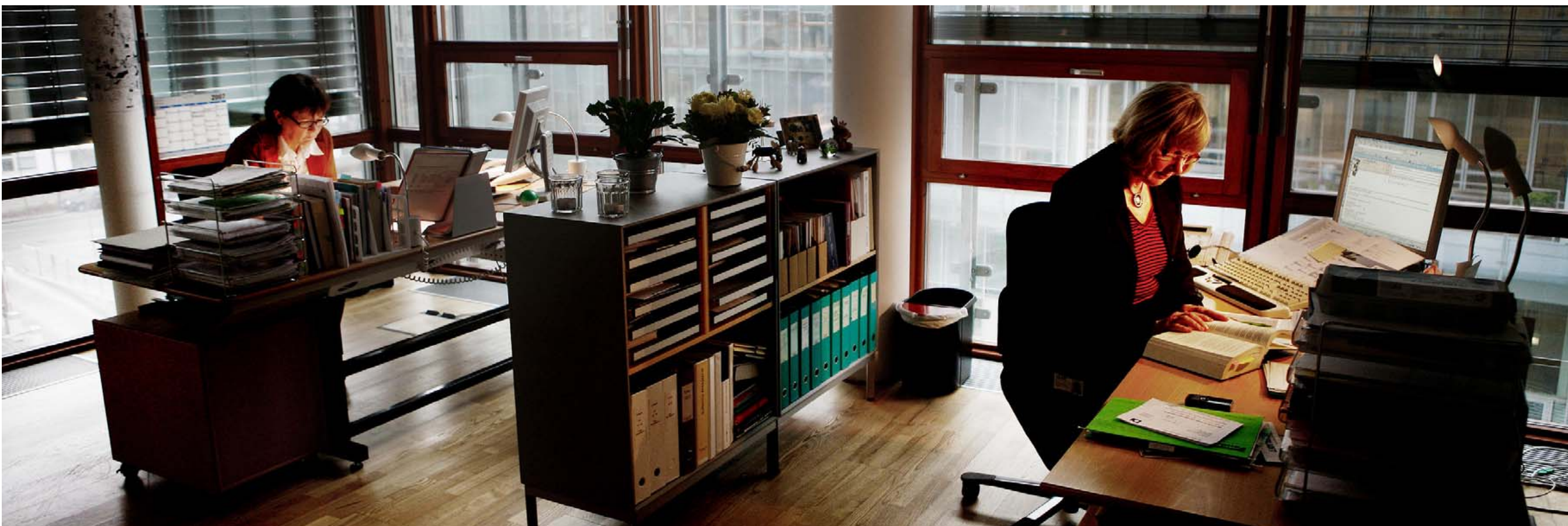
KONTORMUS. Den største positive effekt af outsourcing findes for personer, der gør særligt brug af sprog og kommunikation eller samfundsvidenskabelige færdigheder i jobbet. Det viser den forskning, som dagens skribenter står bag.